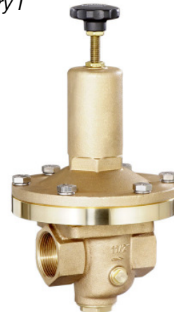
DN 32 - DN 50